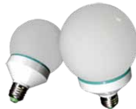
LAH-H-10400 / LAH-H-010700

PRODUCTOS: Fabricados por la más alta calidad de los materiales a través de la prueba del envejecimiento certificados CE/IEC/ROHS/ISO9000