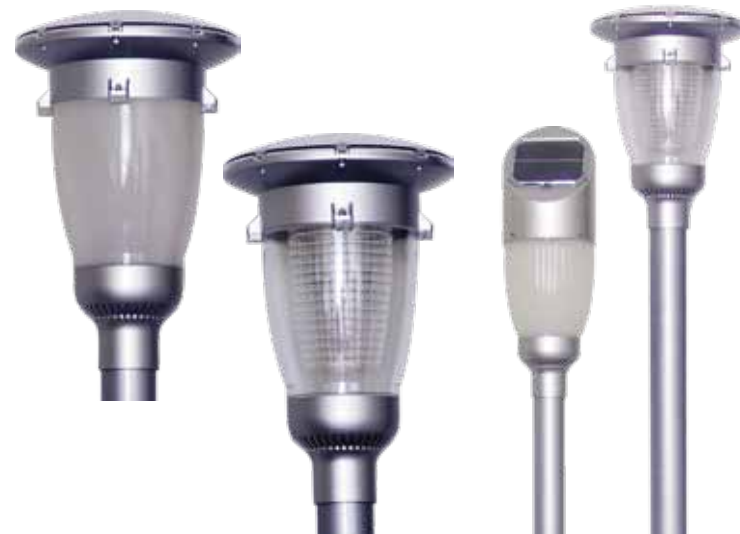
SPH-C00503 / SPH-C00603