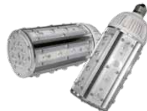
LAH-H11700 / LAH-H11600