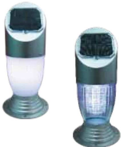
SPH-C00303 / SPH-C00403