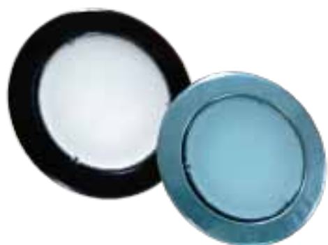
LAH-F00420 / LAH-F00630