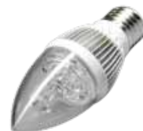
LAH-H-09300 / LAH-H-09500

PRODUCTOS: Fabricados por la más alta calidad de los materiales a través de la prueba del envejecimiento certificados CE/IEC/ROHS/ISO9000