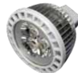
LAH-H-08201 / LAH-H-08301

PRODUCTOS: Fabricados por la más alta calidad de los materiales a través de la prueba del envejecimiento certificados CE/IEC/ROHS/ISO9000