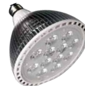
LAH-H-07500 / LAH-H-08000

PRODUCTOS: Fabricados por la más alta calidad de los materiales a través de la prueba del envejecimiento certificados CE/IEC/ROHS/ISO9000