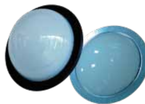
LAH-F01030 / LAH-F01020