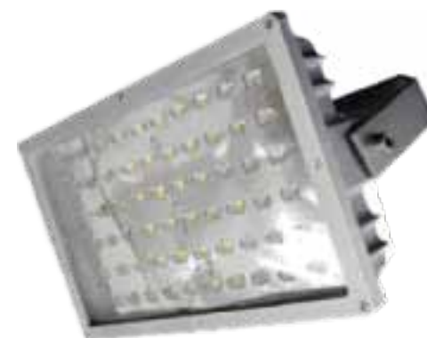
LAH-D02800 / LAH-D03200

PRODUCTOS: Fabricados por la más alta calidad de los materiales a través de la prueba del envejecimiento certificados CE/IEC/ROHS/ISO9000