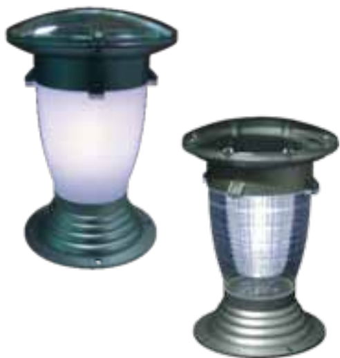
SPH-C00103 / SPH-C00203