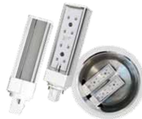
LAH-H10800 / LAH-H13300