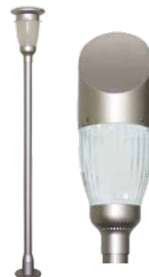
LAH-B00300 / LAH-B00400

PRODUCTOS: Fabricados por la más alta calidad de los materiales a través de la prueba del envejecimiento certificados ETL/CE/IEC/ROHS/ISO9000 ETL/CE/IEC/ROHS/ISO9000