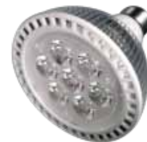
LAH-H-06500 / LAH-H-07200