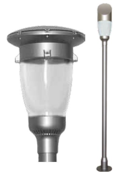
LAH-B00100 / LAH-B00200