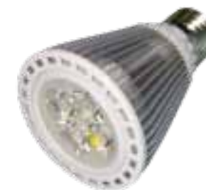
LAH-H-06100 / LAH-H-06400