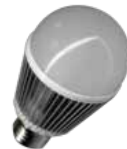
LAH-H-10000 / LAH-H10300