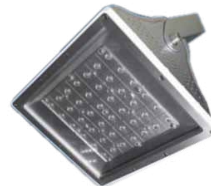
LAH-D03700 / LAH-D03900