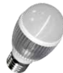
LAH-H-09600 / LAH-H-09900