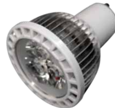
LAH-H-08400 / LAH-H-9200