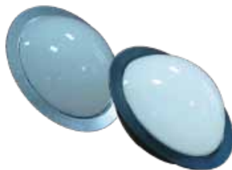
LAH-F00730 / LAH-F00920