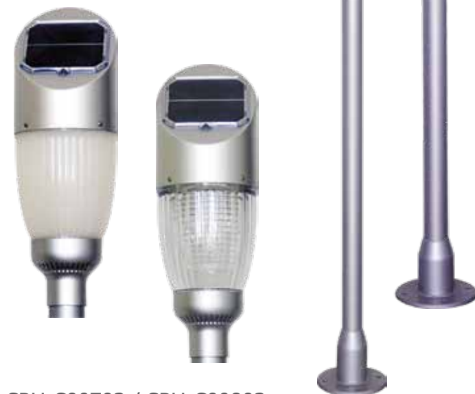
SPH-C00703 / SPH-C00803

PRODUCTOS: Fabricados por la más alta calidad de los materiales a través de la prueba del envejecimiento certificados ETL/CE/IEC/ROHS/ISO9000