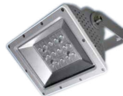
LAH-D03300 / LAH-D03600