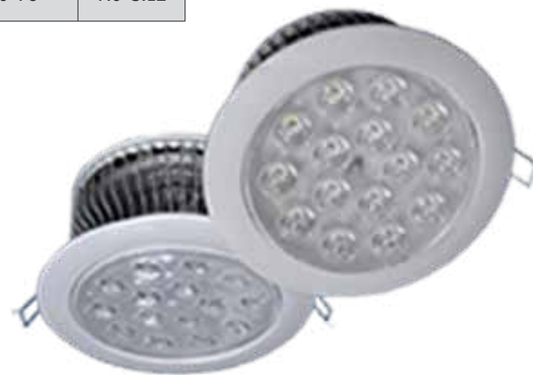
LAH-F02600 / LAH-F03400

PRODUCTOS: Fabricados por la más alta calidad de los materiales a través de la prueba del envejecimiento certificados ETL/CE/IEC/ROHS/ISO9000